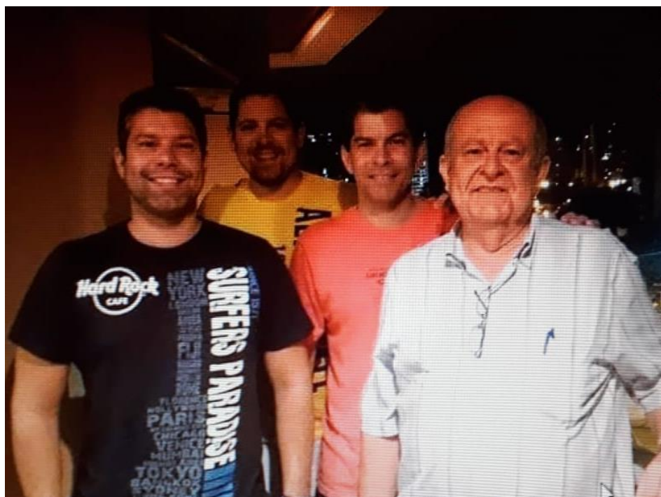
Maluf com seus filhos